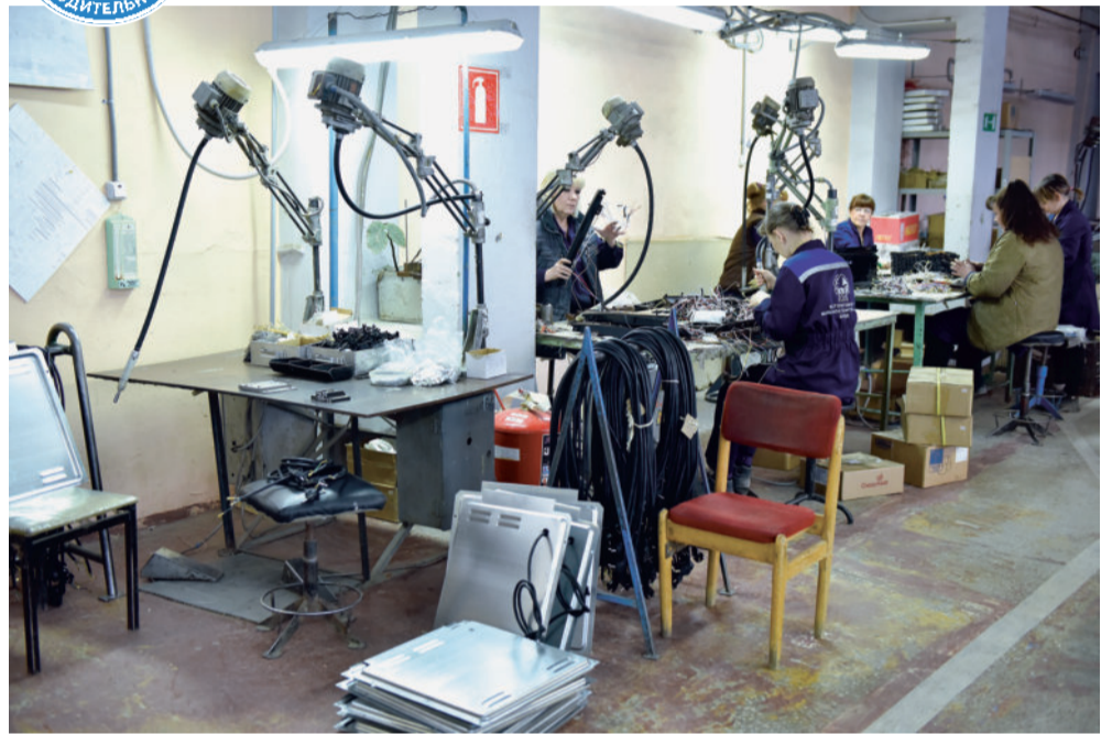
На операции сборки кронштейнов со шнуром.