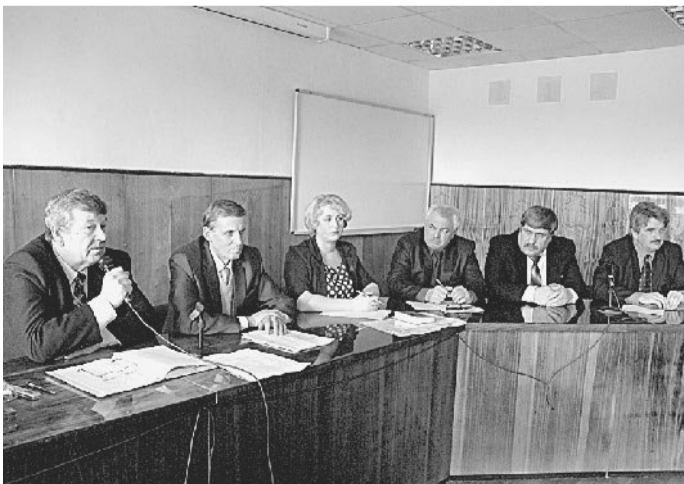
Депутаты городского Собрания от района машиностроительного завода провели традиционную встречу с профсоюзным активом предприятия, на которой отчитались о своей работе.