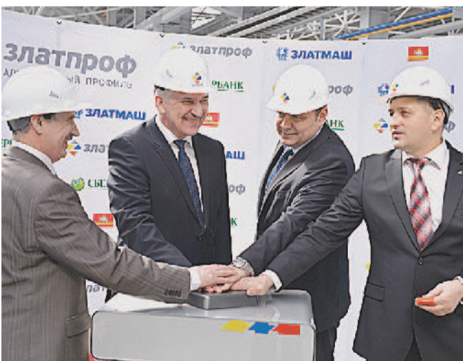
Открытие производства по выпуску алюминиевого экструзионного профиля под брендом «Златпроф».