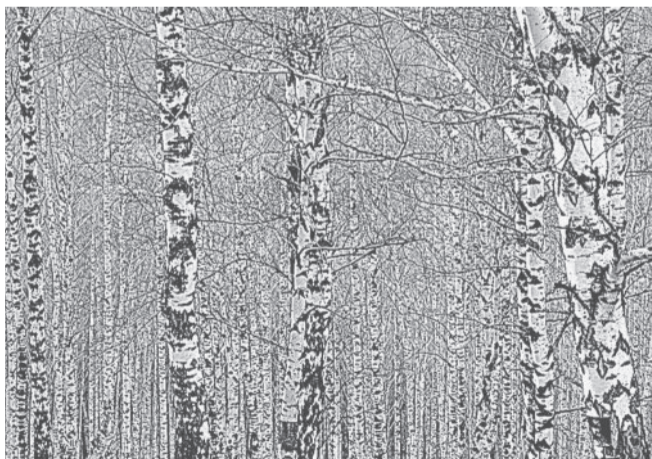
Фотоэтиюд Владимира Голынкина «Белые берёзы».

берёзках белых. Ведь где они — там Родина моя. И только в этом, в этом всё и дело. Мне ностальгия будет песни петь, Где б ни был я — на море ли, на суше. И я вернусь обратно, чтобы впредь Себе печалью не бередить душу.