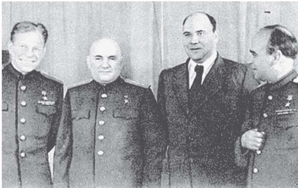
Слева направо: Д. Ф. Устинов, Б. Л. Ванников, А. И. Ефремов, В. А. Малышев. (1943 г.)