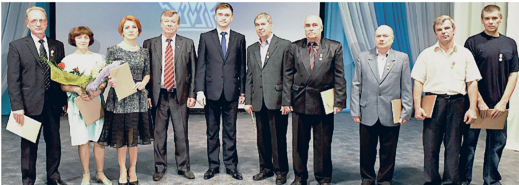
ЧЕСТВУЮТ ЛУЧШИХ. Восемь работников удостоены звания «Заслуженный ветеран труда АО «Златмаш».