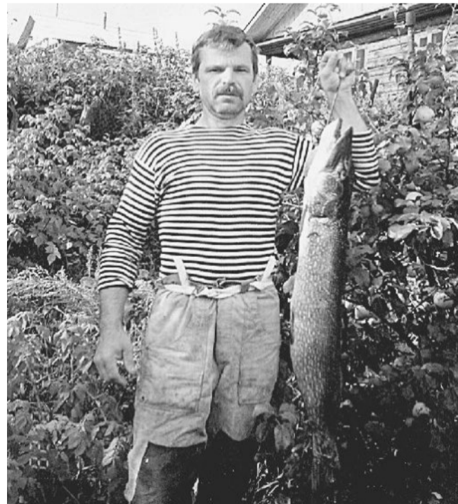
ТРОФЕЙ. Щука весом в 6 килограммов.