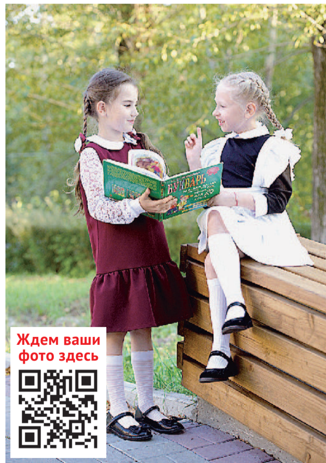
Фото присылать по адресу: presszlatmash@mail.ru или по QR-коду.

Предлагаем вашему вниманию новую ФОТОрубрику. Здесь вы можете поделиться своими фотографиями на определенные темы. Оригинальные снимки будут опубликованы на страницах газеты, в официальной группе АО «Златмаш» ВКонтакте и займут почетное место на фотовыставке, посвященной 80-летию нашего издания. Итак, поехали! Сегодняшняя тема рубрики «День знаний».