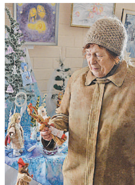
КРАСОТА! В выставочном зале «Башни-колокольни» ветераны побывали на экспозиции «Зимняя сказка».

— Когда немцев погнали от Москвы, они нас с собой угнали для прикрытия. Сначала в сборный пункт привезли на телегах с другой области. Потом посадили на платформы, кого в телютник. Группами компоновали. Использовали как живой щит, чтобы немецкие эшелоны не бомбили. Не знаю, чем бы закончи-