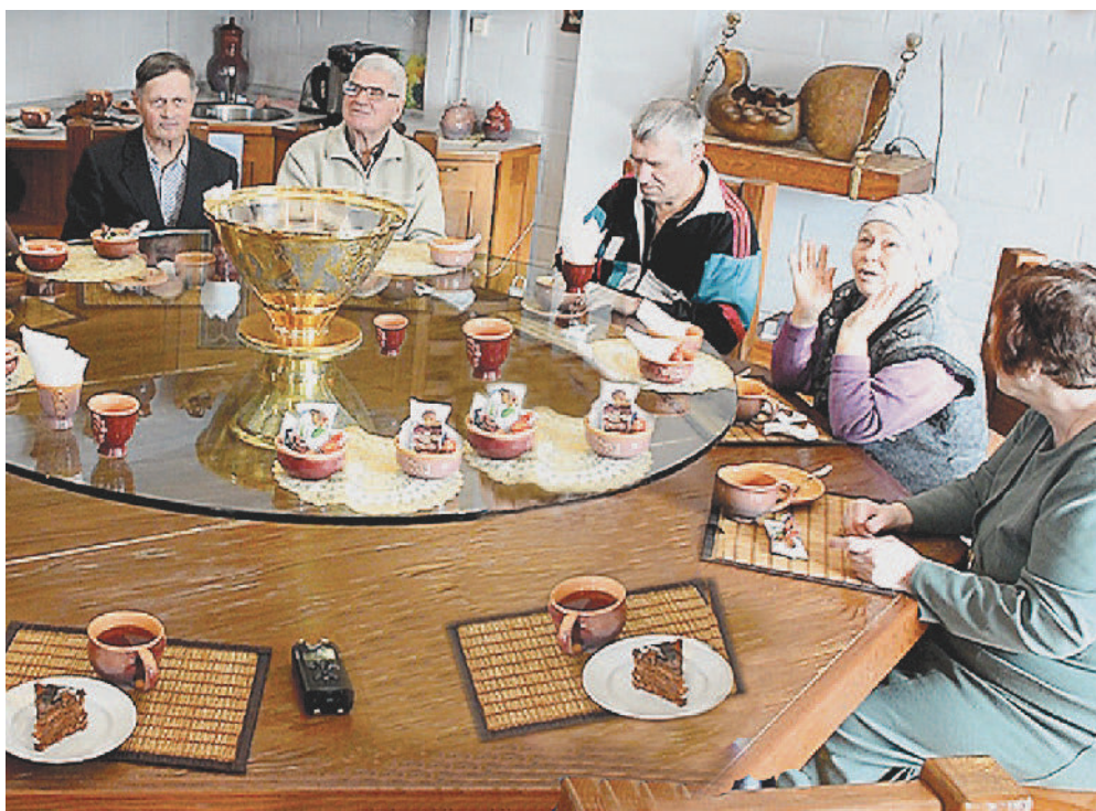
ЗА ЧАШКОЙ ЧАЯ. Нахлынули воспоминания о прошлом, о молодости.