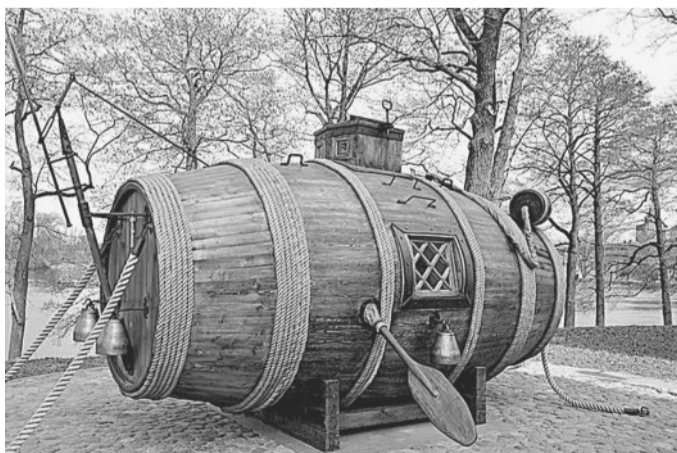
ПОТАЁННОЕ СУДНО. Царь Пётр увидел в этом изобретении необычайную полезность для государства.