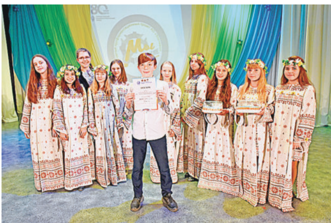
КОМАНДА ШКОЛЫ № 37. Второе место — тоже победа!

Работники Златоустовского машиностроительного завода в этом году вновь боролись за звание лучшего по профессии. Соревнования по компетенциям «Инженерная графика САД», «Фрезерные работы на станках с ПУ» и «Электротехника» прошли в рамках корпоративного чемпионата «Профессионалы Златмаш-2019», посвящённого 80-летию предприятия.