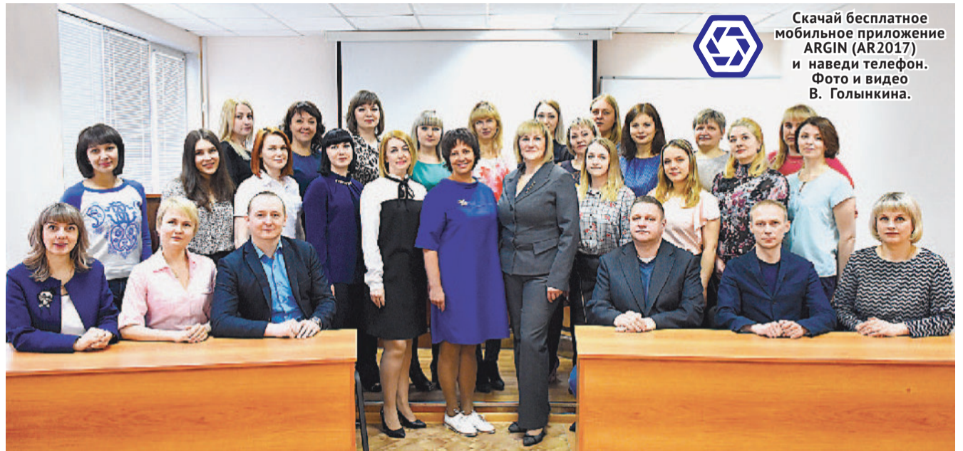
КАДРЫ РЕШАЮТ ВСЁ.