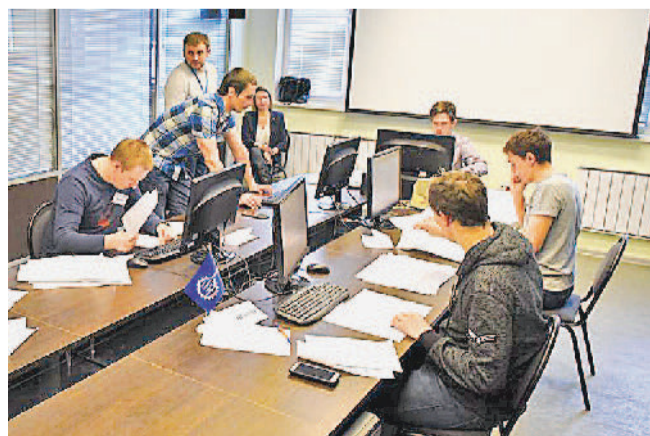
ЧЕМПИОНАТ АО «Златмаш» «Профессионалы-2019» (инженерная графика CAD).