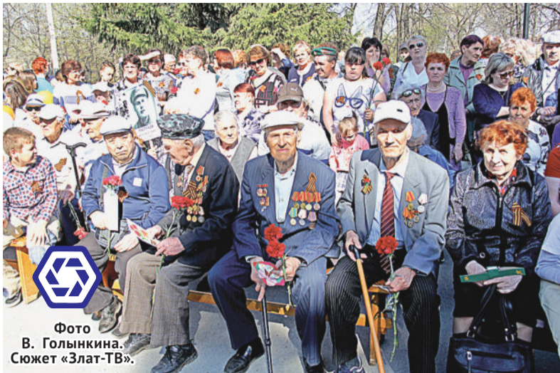
Фото В. Голынкина. Сюжет «Злат-ТВ».

К Дню Победы АО «Златмаш» традиционно подготовило для златоустовцев ряд мероприятий: митинг памяти у обелиска Славы, легкоатлетическую эстафету на приз газеты «Трудовая честь Златмаш» и праздничный концерт у Дворца Победы, а вечером небо окрасилось залпами салюта.