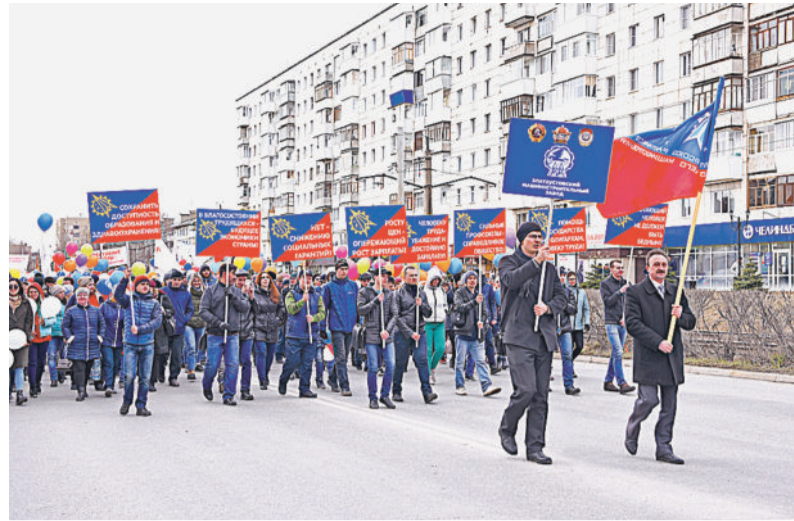
ЯРКИЙ, МНОГОЧИСЛЕННЫЙ, СПЛОЧЁННЫЙ. Коллектив АО «Златмаш» было видно издалека.