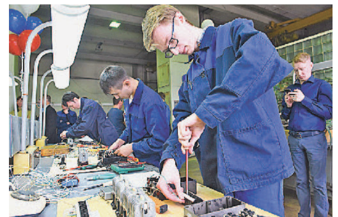
ЧЕМПИОНАТ АО «Златмаш» «Профессионалы-2019» (электротехника).