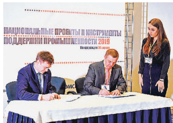
НА НОВЫЙ УРОВЕНЬ СОТРУДНИЧЕСТВА.

Мероприятие было организовано Правительством Челябинской области, АНО «Федеральный центр компетенций в сфере производительности труда» и Фондом развития промышленности Челябинской области. В нём приняло участие около 300 руководителей и специалистов крупных предприятий региона, представителей малого и среднего бизнеса, Минпромторга РФ, Минэкономразвития РФ, Федерального фонда развития промышленности, Российского экспортного центра и Законодательного собрания Челябинской области. Цель встречи — освещение возможностей, которые предоставляют для предпринимательства нацпроекты «Повышение