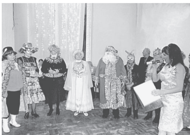
ВЫБРАТЬ ТРУДНО! Красочные костюмы для новогоднего парада ветераны придумывали и шили сами.

В этот вечер для ветеранов выступили лучшие творческие коллективы ДК