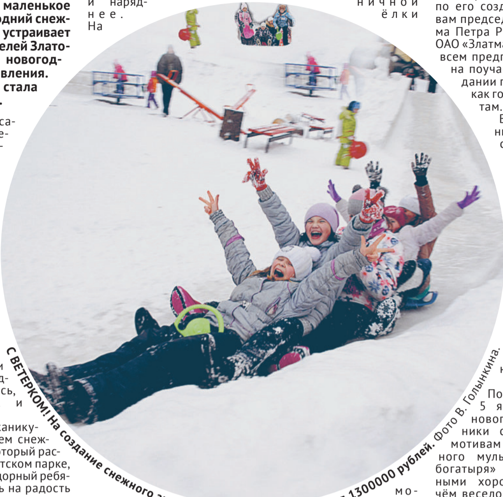
С ВЕТЕРКОМ! На создание снежного зимнего городка завод потратил 1300000 рублей.

— Оставить жителей района без праздничной ёлки