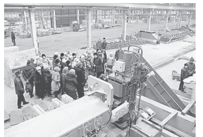
СВОИМИ ГЛАЗАМИ. Профактивисты побывали на новом производстве.

Все нововведения на предприятии вызывают неизменный интерес у заводчан, тем более такой крупный инвестиционный проект. На экскурсии предцехкомы имели возможность не только увидеть всё своими глазами, но и получили исчерпывающие ответы на все интересные вопросы, касающиеся