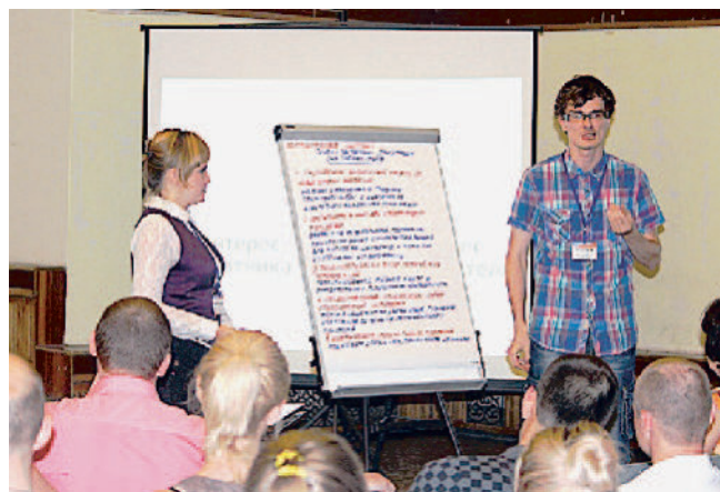
ЗАЩИТА ПРОЕКТА. Заводчане представляют предвыборную программу.