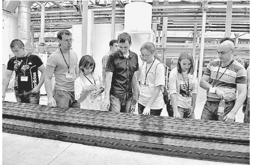
ФОРУМЧАНЕ НА ЗАВОДЕ. Экскурсия на производстве алюминиевого профиля.