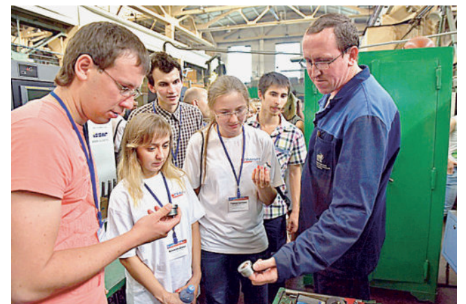
ФОРУМЧАНЕ НА ЗАВОДЕ. Экскурсия на производстве КМУ.