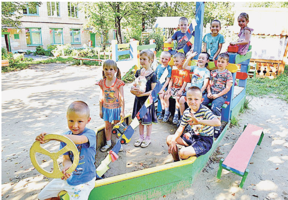
КУРС ВЕРНЫЙ! Детворе из детского сада № 12 никакой шторм не страшен: шефы всегда рядом!

Стоит отметить, что с подшефными учреждениями Златоустовский машиностроительный завод сотрудничает на протяжении всего года.