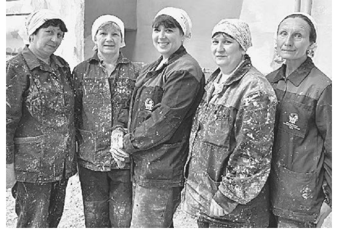
Дружная бригада маляров.