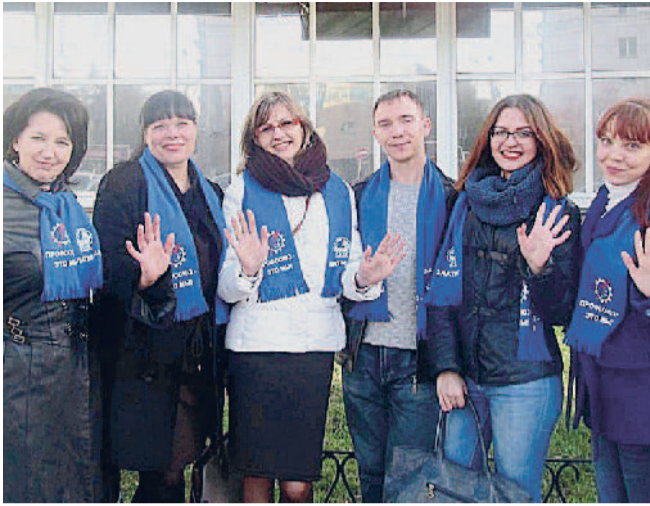
Делегация АО «Златмаш».

Профсоюзный актив завода принял участие во Всемирной акции профсоюзов «За достойный труд!», который прошёл в Челябинске.