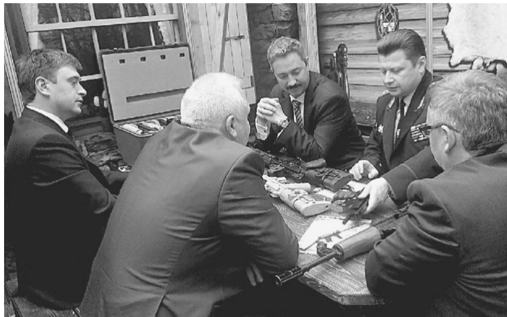
НА СТЕНДЕ АО «ЗЛАТМАШ».