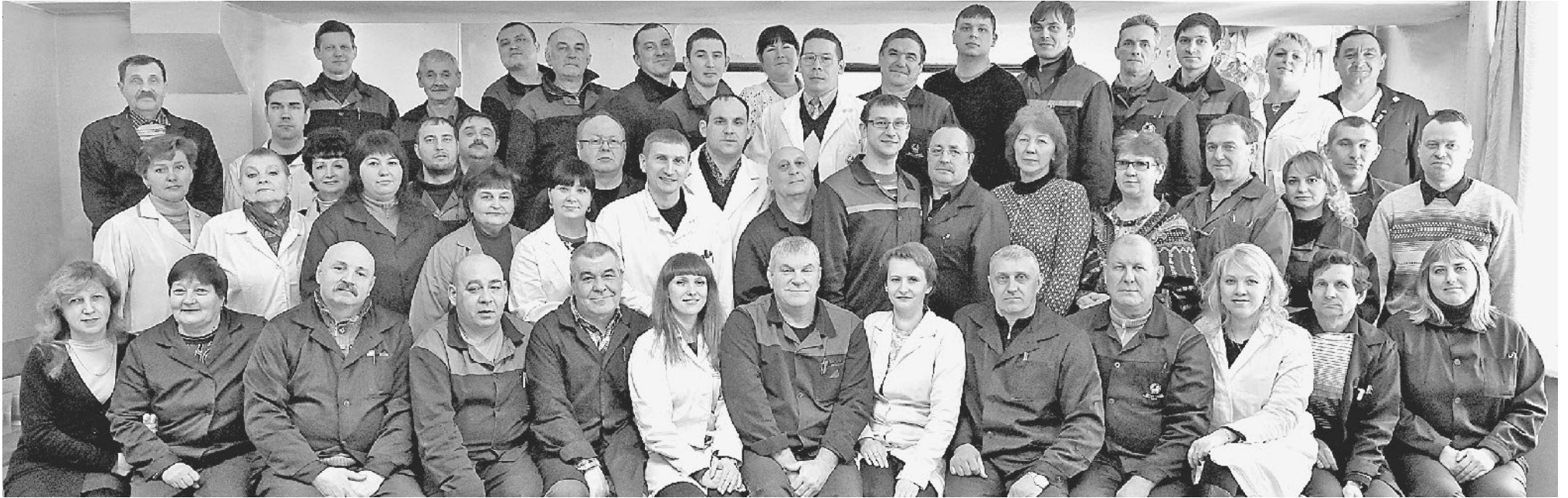
БЕЗОПАСНОСТЬ РОССИИ В НАДЕЖНЫХ РУКАХ! Дружный коллектив цеха № 28