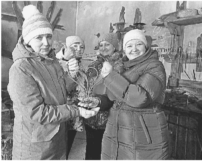
ВЫКОВАНО С ЛЮБОВЬЮ!

29 витязей сильного и прекрасного пола вышли на поле мирной брани помериться силушкой да показать своё богатырское братство. Предварительно все они прошли отбор жёсткий, отвечая на вопросы викторины. Вопросы касались войск бронетанковых да авиации. Задания стали проверкой настоящей для заводских эрудитов, но награда стоила того.