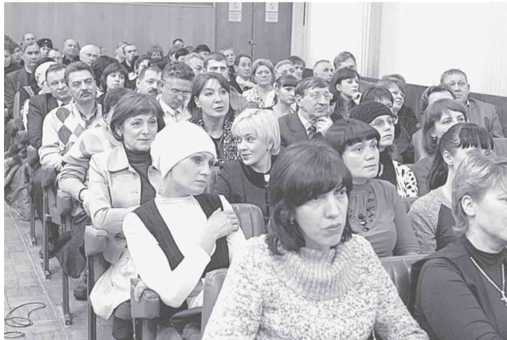
Делегаты конференции 2011 года.

Компенсация посещений работниками составляла 50 %, а их детям – 100 % стоимости. Общая сумма компенсации за 10 месяцев соста-