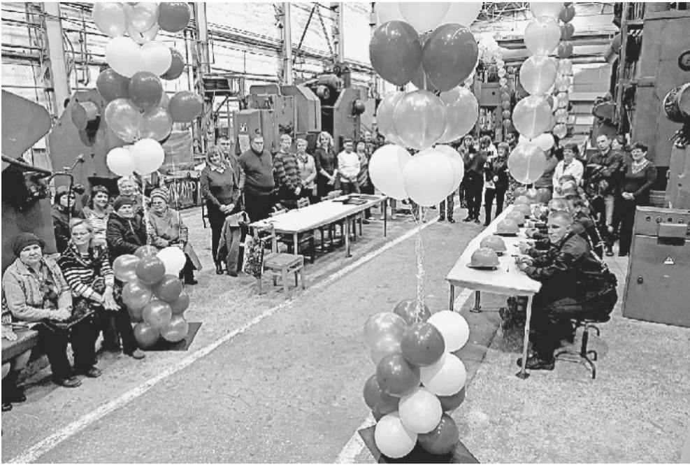
ПРАЗДНИК ДЛЯ ПРОФЕССИОНАЛОВ. За конкурсантами наблюдали не только члены жюри, но и приглашённые на праздник ветераны.